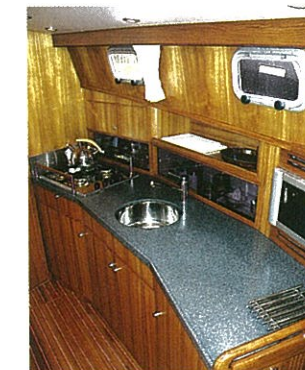
Die Küchenzeile befindet sich steuerbords im Salon