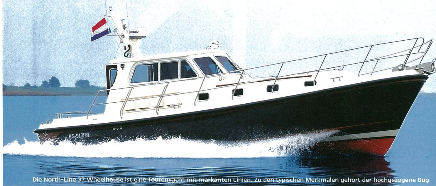
Die North-Line 37 Wheelhouse ist eine Tourenyacht mit markanten Linien. Zu den typischen Merkmalen gehört der hochgezogene Bug