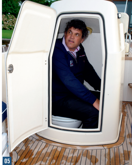
05 De ruim 2 meter lange eigenaar van deze North-Line 800 kan rechtop zitten op het toilet.

(zie de test in de Motorboot van september 2007), is goed te zien aan de romp. De strakke belijning, de teak sprayrails en de rubberen stootrand zijn het onmiskenbare visitekaartje van Jachtbouw Zevenhuizen, evenals het stevige rvs dekbeslag. „Je ziet het”, grinnikt Van Sluis. „Ook voor deze boot hebben we geen Mickey-Mouse spul gebruikt.”