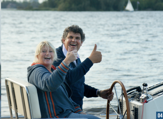
04 De stuurbank biedt ruim plaats aan twee personen.